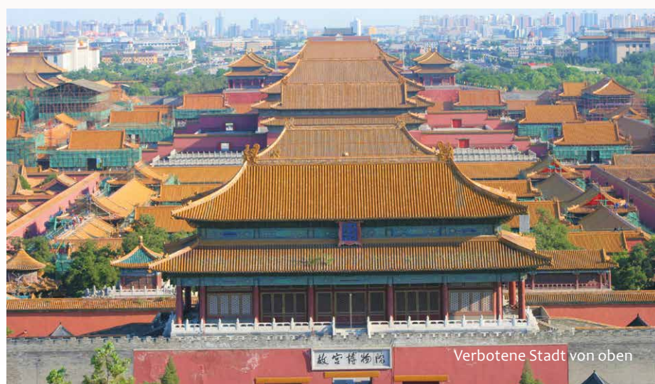
Verbotene Stadt von oben