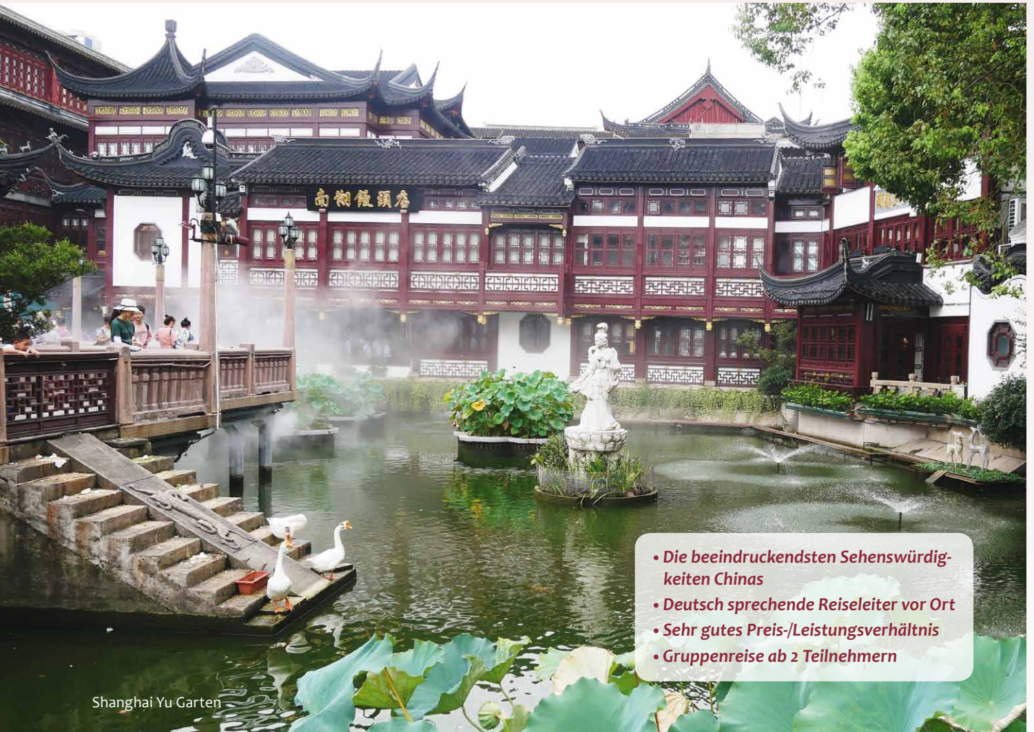
Shanghai Yu Garten

Peking - Xi'an - Shanghai in 10 Tagen. Wer sich einen kompakten Überblick über die wichtigsten Sehenswürdigkeiten Chinas verschaffen will, ist hier genau richtig! Die Große Mauer in Peking, die berühmte Terrakotta-Armee in Xi'an und die futuristische Skyline von Shanghai - dies und noch viel mehr erleben Sie auf unserer China-Reise zum Kennenlernen. Maximale Flexibilität bieten wir Ihnen dazu mit passenden Flugangeboten und vielen Verlängerungsmöglichkeiten.